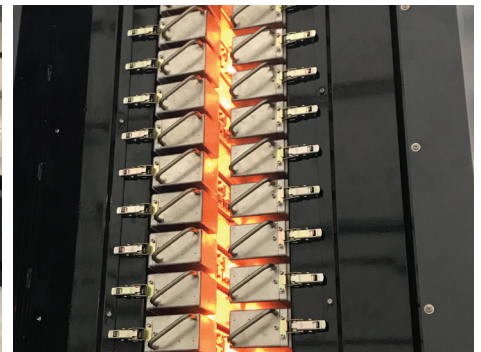
Trocknungseinheit für Wasserlack mit werkzeugloser Kassettenentnahme zur Wartung